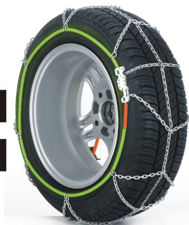
Pneumatico con catene montate